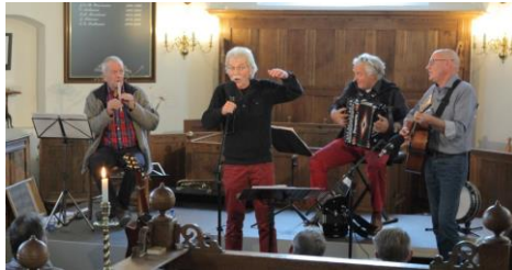
optreden in Huzum

dan gean ik nei fiere lannen en sykje ik om it bern werom nei it ferline dêr ha ik it lang lyn ferlern